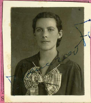
a assignatura da autoridade sanitaria