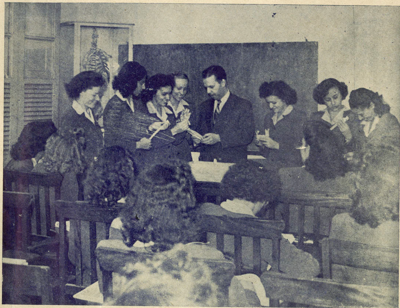
AULA DE ANATOMIA