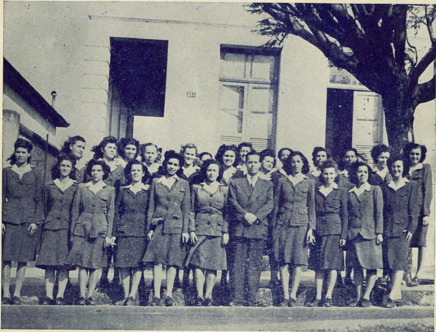
ALUNAS DO CURSO PRELIMINAR