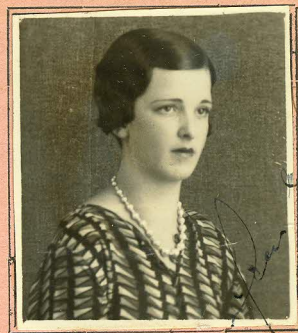
Só é valido o retrato que tiver a assinatura da autoridade sanitária.

Matriculas no serviço H. P. - 13.749 N. S. O. - 10.748