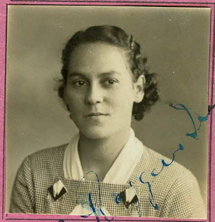
Só é valido o retrato que tiver a assignatura da autoridade sanitaria