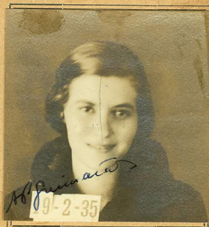
Só é valido o retrato que tiver a assinatura da autoridade sanitaria.